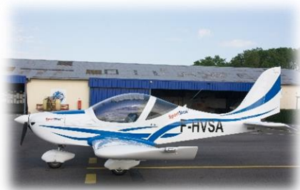
2 EVEKTOR SPORTSTAR