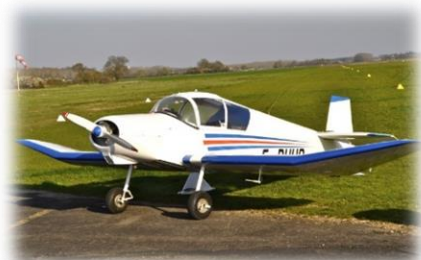
1 JODEL D112